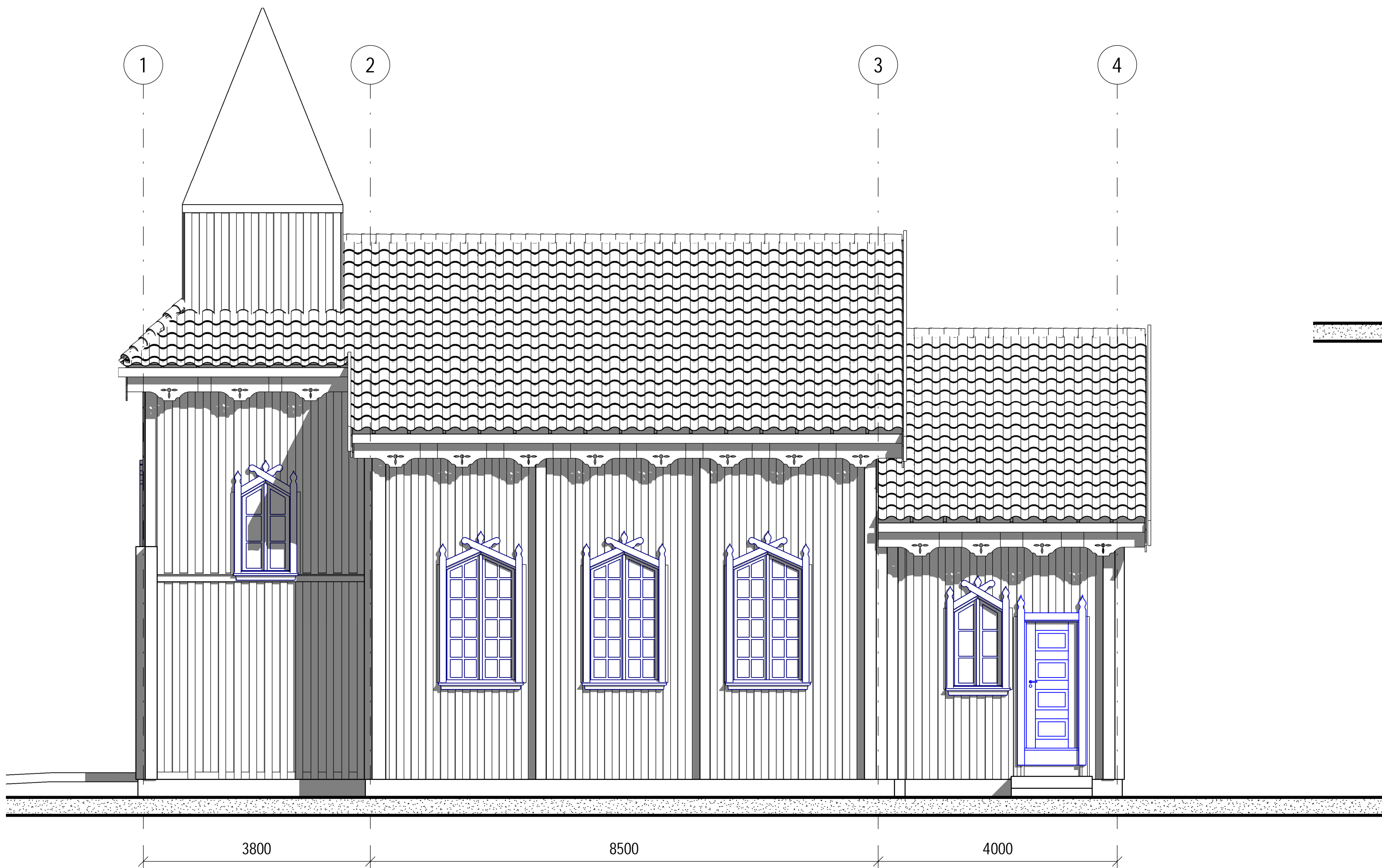
Fasade Sør 1 : 50